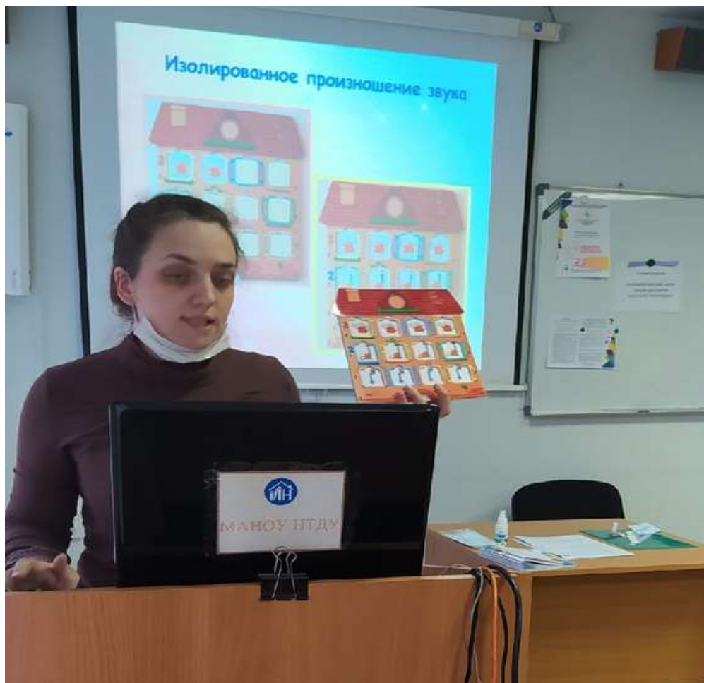
Фасилитация опыта использования авторских развивающих пособий на городском методическом объединение учителей-логопедов (2021 год)